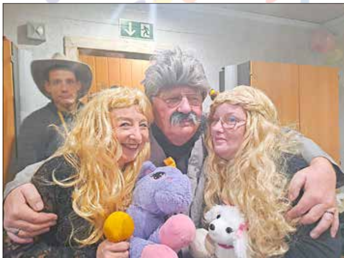
Auch im ASB waren wir wieder erfolgreich vertreten, und konnten den Bewohnern einen schönen Abend bereiten.