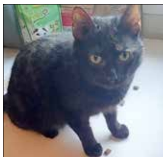
Lawina und Ivo

Es wird nicht lange dauern und die ersten kleinen und großen Notfellchen werden unsere Hilfe brauchen, aber bis dahin muss auch ausreichend Platz vorhanden sein. Sind Sie auf der Suche nach einem samtpfotigen Mitbewohner, dann besuchen Sie unsere Homepage und schauen Sie in unsere Rubrik „Vermittlung“. Sie finden uns auch auf Facebook.